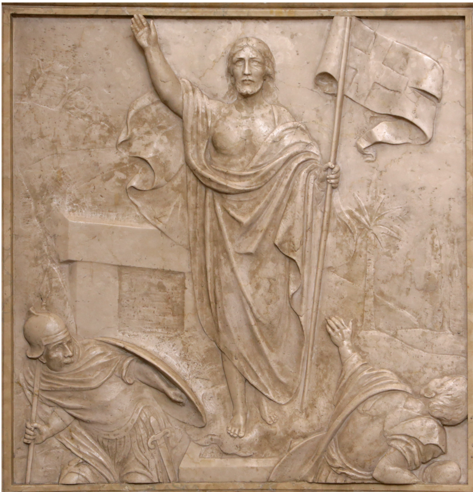
RISURREZIONE DI GESÙ - Bassorilievo in marmo dell'altare maggiore nella Chiesa di San Paolo